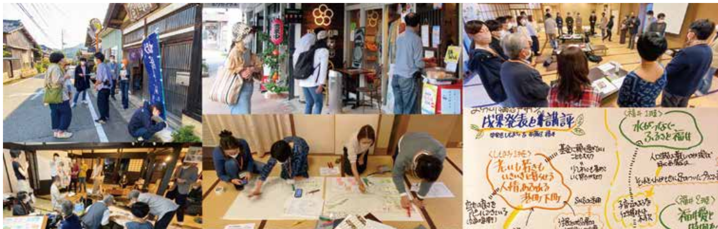
昨年（第8期）地域づくりコーディネーター養成講座の様子